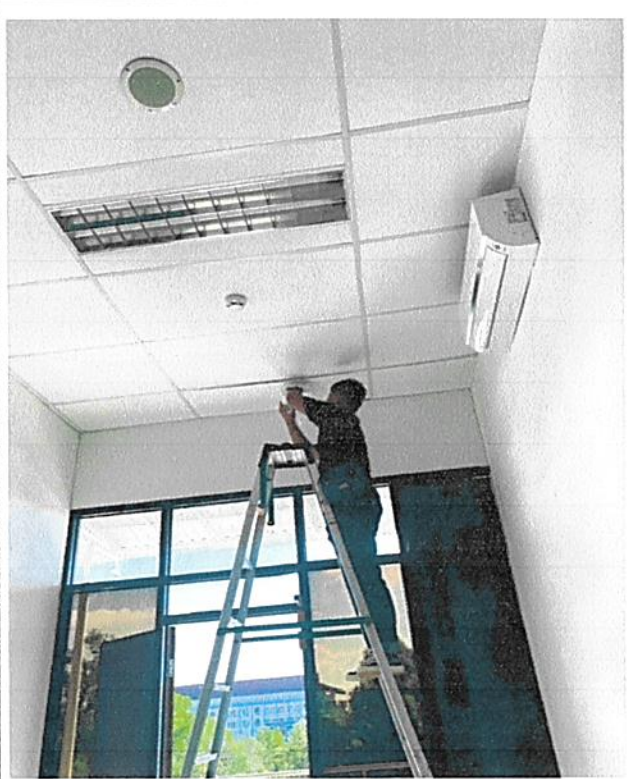
Pemasangan Access Point di depan Ruang Hakim