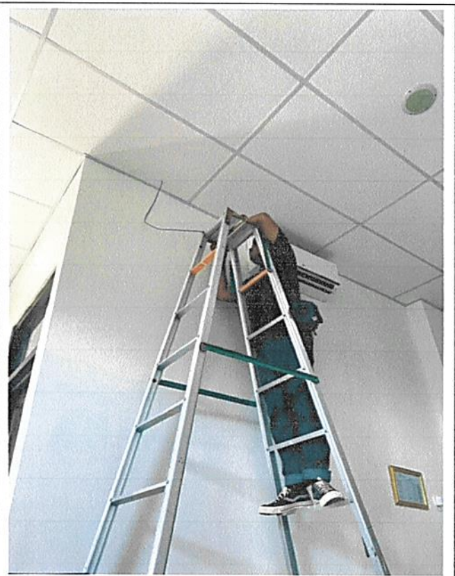
Pemasangan Access Point di Ruang PTIP

Setelah pemasangan Access Point, dicek untuk jaringan wifi terpantau stabil dan sudah dapat digunakan oleh user masing-masing.