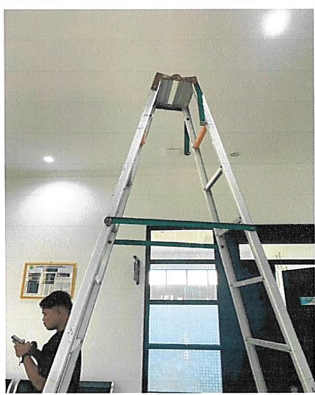
Pemasangan Access Point di Depan Ruang Sekretaris

Tindak Lanjut: Centro Network melakukan Visitasi ke Pengadilan Tata Usaha Negara Pangkalpinang dan menambah 4 (Empat) Access Point yang dipasang di Ruang-Ruang berikut: